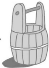
责任细化——防止社会懈怠

如果集体工作中有一个人有偷懒行为,那么其他人就会感觉不公平,进而相继出现偷懒松懈的现象,致使工作效率出现下滑。